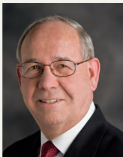
Рей Клингсмит, ПРЕДСЕДАТЕЛ НА СЪВЕТА НА ПОПЕЧИТЕЛИТЕ НА ФОНДАЦИЯ РОТАРИ