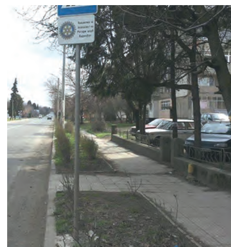
Проект на РК Карнобат, съвместно с други клубове от зоната - поставяне на знаци „Внимание деца“ на възлови места до училища, детски градини и оживени улици.